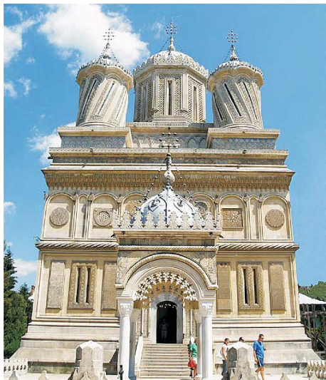
Fig. 2. Iglesia del monasterio de Curtea de Arges, mandado construir por Basarab I.

De todas maneras, se piensa, debido a su situación algo alejada de los principales caminos de tránsito hacia el norte y por encontrarse en una colina a 180 metros sobre el valle del Arges, que su verdadera utilización era como puesto de observación. Idea que se refuerza al tener en cuenta que el único asedio conocido a Poienari es el de las tropas turcas en el verano del año 1462.