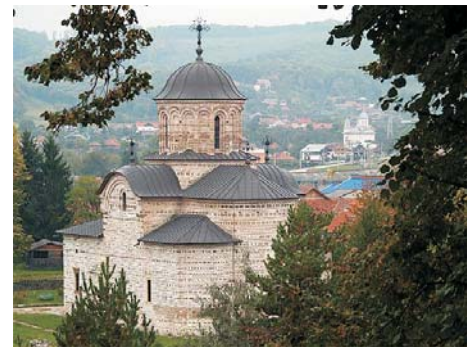
Fig. 1. Iglesia de la corte principesca.

La leyenda de este monasterio nos indica que el príncipe encomendó esta construcción al maestro Manole, pidiendo que fuese la obra más hermosa jamás construida. Pero todo lo que durante el día se construía se derrumbaba por la noche. Durante un sueño, Manole ve a un ángel que le dice que tiene que sacrificar a su esposa Ana, a la cuál debería emparedar en uno de los muros del monasterio. Al segundo día, Ana aparece por el camino para llevar la comida a su esposo, el cuál cumple con el sueño