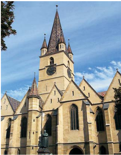
Fig. 9. Iglesia Evangélica.