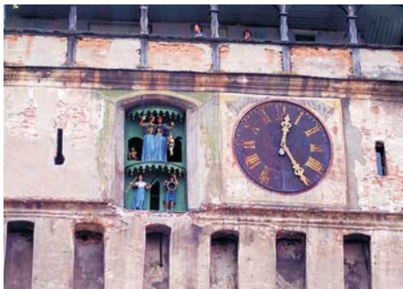
Fig. 6. Reloj y hornacina de la fachada que da a la Ciudadela.

frido, principalmente durante el siglo XIX. Esta adosada directamente en el muro, por lo que desde el exterior parece mucho más alta que desde dentro de la Ciudadela. Tiene dos pisos, dotados de troneras para el disparo, ventanas y huecos preparados para arrojar líquidos hirvientes a los asaltantes.