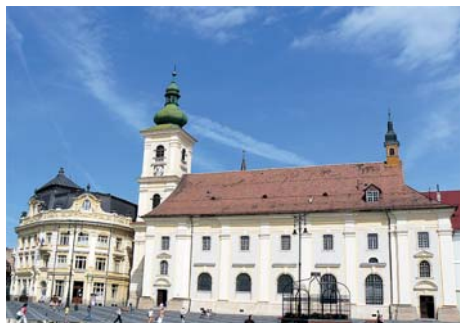
Fig. 2. Piata Mare o Plaza Mayor.

Por el lado norte, junto a la iglesia Romano Católica, se encuentra la Casa Parroquial Romano Católica , construida en 1939. A continuación se haya un edificio que fue el lugar don-