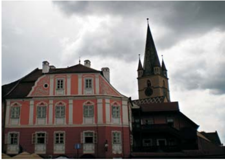
Fig. 5. Piata Huet.