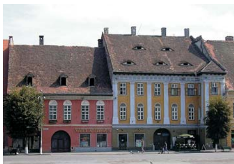
Fig. 3. Los "Ojos de la Ciudad", situados en la Piata Mare o Plaza Mayor.