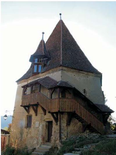
Fig. 4. La torre de los Zapateros.

derada como parte del muro defensivo. Es la primera torre en ser mencionada en un documento, concretamente del año 1511, esta construida en el punto más alto de la Ciudadela, en la zona suroeste de la altiplanicie superior. Es una construcción rodeada de muchas leyendas y habiendo tenido una importancia histórica extrema, finalmente ha pasado a un segundo plano en la actualidad.