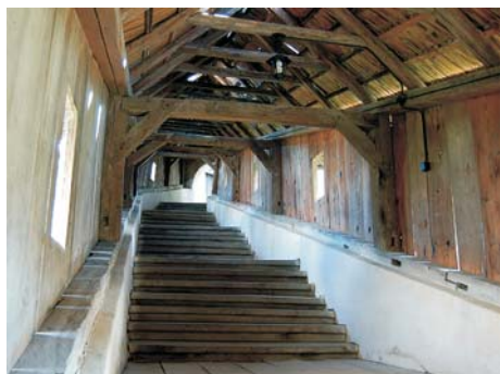
Fig.3. Escalera cubierta de madera que une la parte inferior con la superior del recinto defensivo.

La ciudad de Biertan es uno de los primeros asentamientos de la población Sasi en Transilvania.