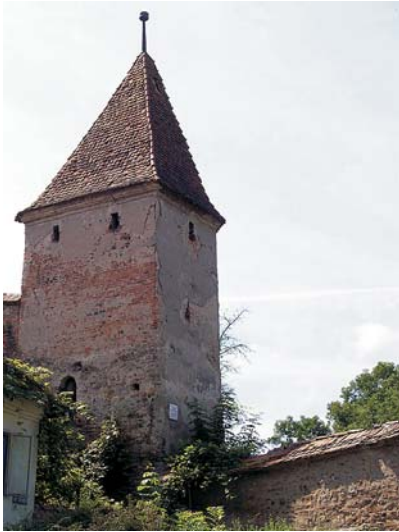
Fig. 3. La torre de los Cordeleros.