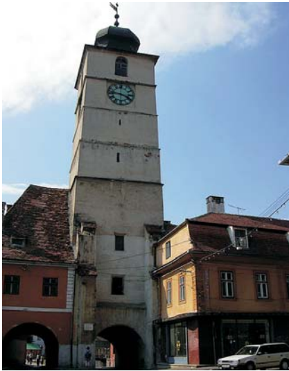
Fig. 6. La torre del Consejo.