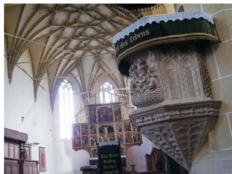
Fig. 2. Interior de la iglesia, en primer plano el púlpito y al fondo el altar.