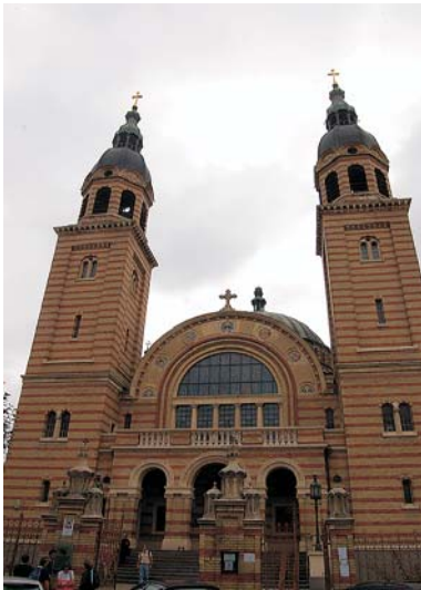
Fig. 10. Exterior de la catedral Ortodoxa de la Santísima Trinidad.

Esta iglesia ha servido como lugar de enterramiento de personas ilustres de la ciudad. Las lápidas funerarias son piedras cogidas de la propia nave del templo en el año 1853 y forman una serie de nichos en sus propios muros, logrando una galería de 67 tumbas única en el país. Las más antiguas son las de Georg Hecht (1496) y Nicolaus Proll (1499).