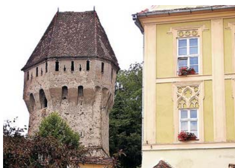
Fig. 2. La Torre de los Estañeros.