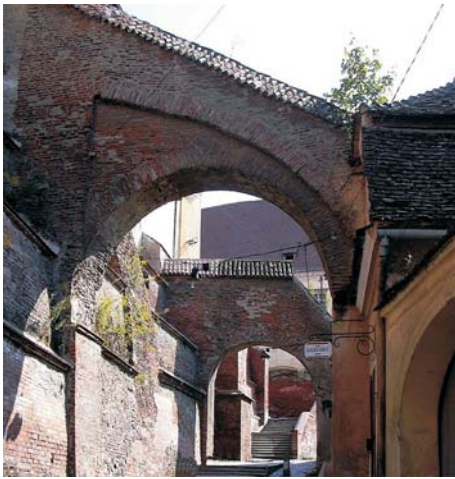
Fig. 7. Pasaje de las Escaleras, una de las vías de comunicación entre la parte alta y baja de la ciudad.