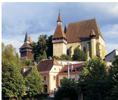
Fig. 1. Exterior de la iglesia-fortaleza.