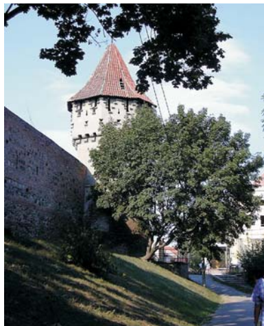
Fig. 1. Parte de la muralla.

Esta comprobado que los primeros asentamientos humanos en la zona de Sibiu datan del Paleolítico, aunque no se puede considerar como verdadera fundación del área urbana hasta el principio del siglo XII con la llegada de los colonos "sasi". Es el año 1150 , son personas de origen flamenco y teutón, colonos germanos del territorio del Rin y del Mosela, los que se asientan en esta zona de Transilvania, fundando " Villa Hermani ", que será el centro del territorio colonizado en la zona de Sibiu y alrededores.