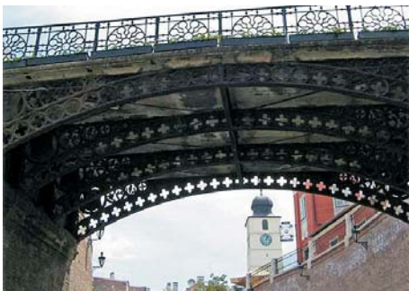
Fig. 8. El puente de los Mentirosos. Al fondo a la derecha se observa la torre del Consejo.

forzar los muros por donde discurre, la muralla y la iglesia Evangélica. Fue construido en el siglo XIII y todavía conserva su aspecto original. Al final del pasadizo, lado sur, se alcanza la parte alta de la ciudad, donde nos encontramos con " turnul Scarilor " o la torre de las Escaleras , uno de los más viejos edificios de Sibiu, ya que data del siglo XIII. Esta torre defensiva está pegada al edificio del antiguo ayuntamiento y es una de las zonas mejor conservadas de la muralla que representaba el tercer cinturón defensivo. Su forma es cuadrangular, con un pasadizo en forma de arco.