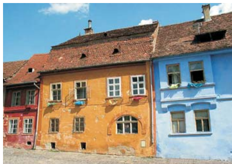
Fig. 1. Fachadas de las casas de los artesanos.

A continuación vendría TURNUL GIUVAERGILOR o AURARILOR -de los JOYEROS-, que en la actualidad no está consi-