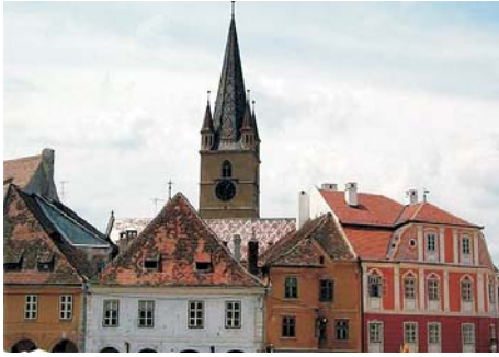
Fig. 4. Piata Mica o Plaza Pequeña. Al fondo la torre de la iglesia Evangélica.

de se estableció la primera alcaldía de la ciudad, el cuál se encuentra junto a la torre del Consejo . Debajo de ésta se hay dos túneles que unen esta plaza con Piața Mica o Pequeña .